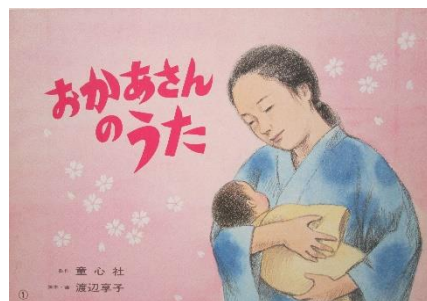
『おかあさんのうた』 童心社 渡辺 享子／脚本・画