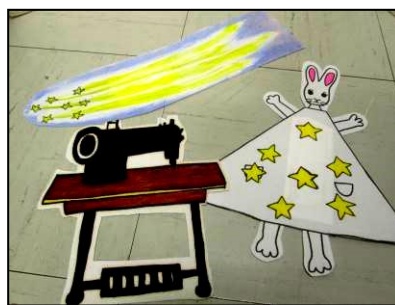
↑パネルシアターのピース