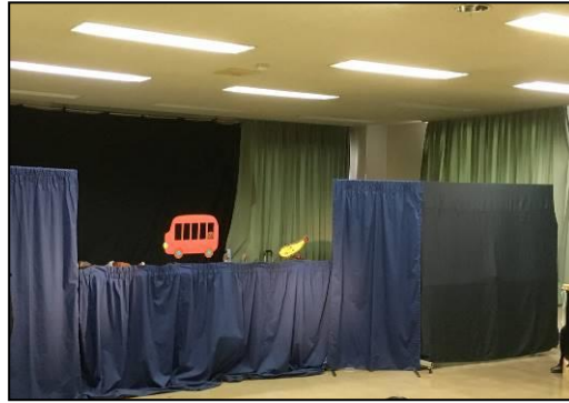
← 人形 劇舞 台