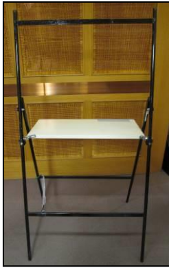
← パネル スタンド